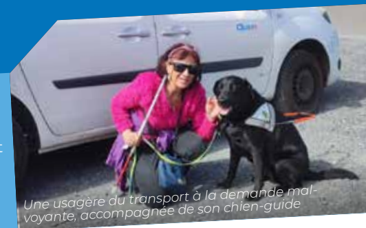
Une usagère du transport à la demande malvoyante, accompagnée de son chien-guide

Maison d'Yvette 15, Rue du Docteur Gallet 74300 CLUSES Tél. 04 50 96 14 13 pole.gerontologie@cluses.fr