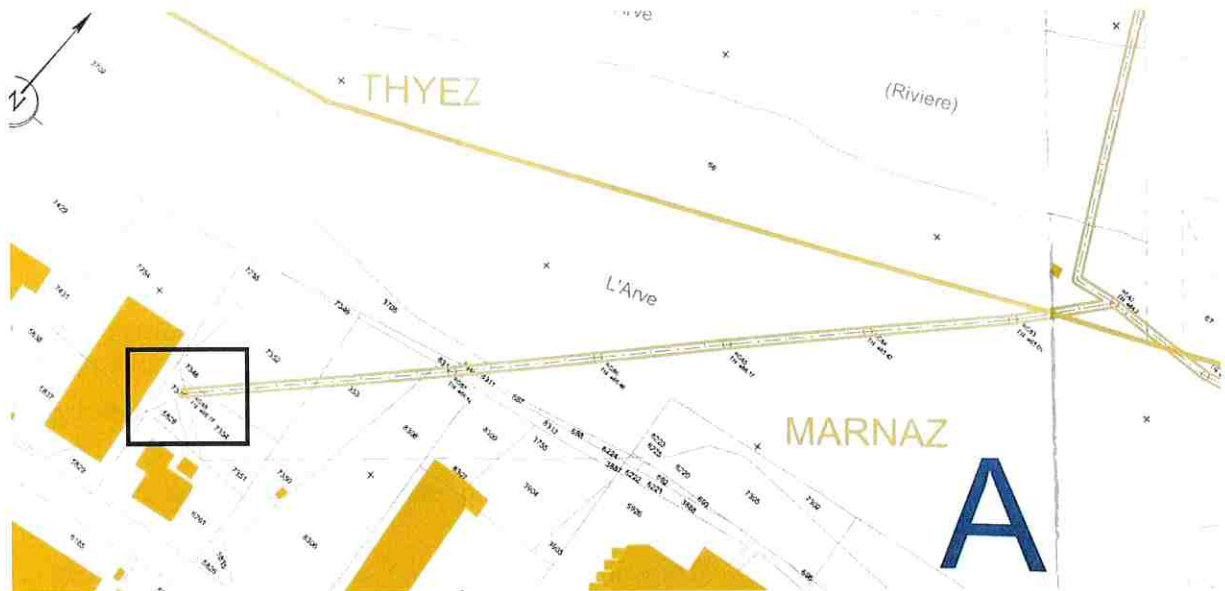
Extrait des plans de la servitude du dossier d'enquête - planche n°12

Il semblerait donc que le collecteur avait bien été aménagé sur des parcelles communales à son origine.