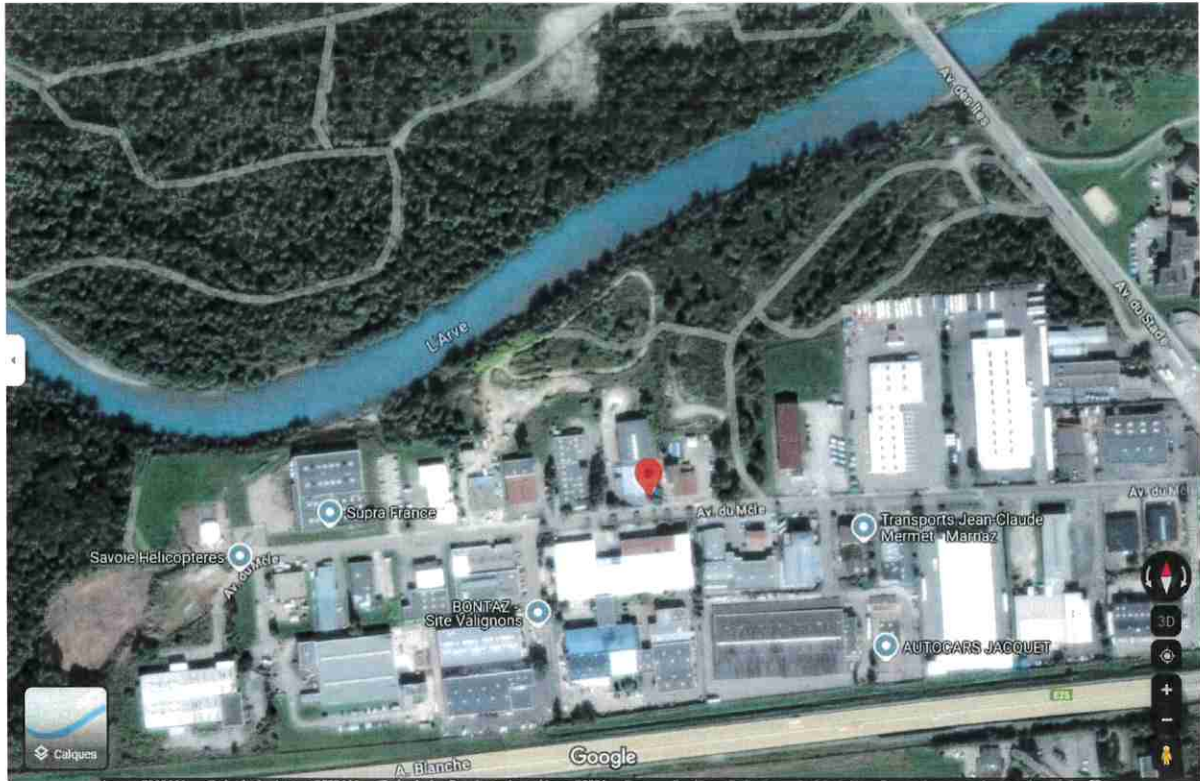
Vue « Google Maps »